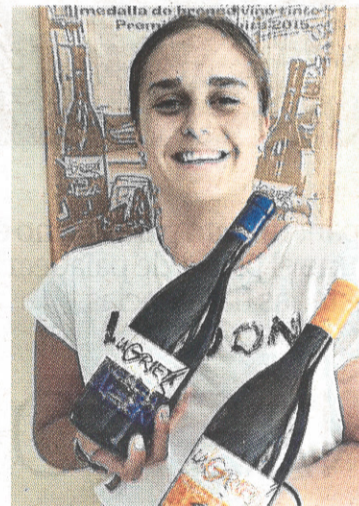
Las nuevas generaciones se preparan para tomar el relevo en la bodega.

cular a los 23.000 litros de vino que vende anualmente.